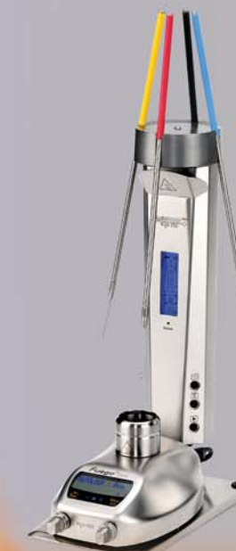
Autoloop PRO mit / with LabFlame IR (plus)