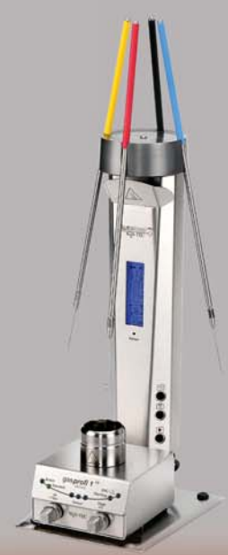
Autoloop PRO mit / with Labflame micro