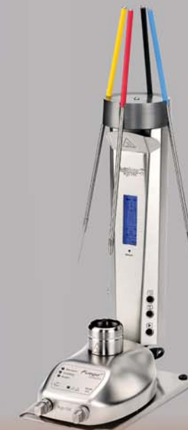
Autoloop PRO mit / with LabFlame